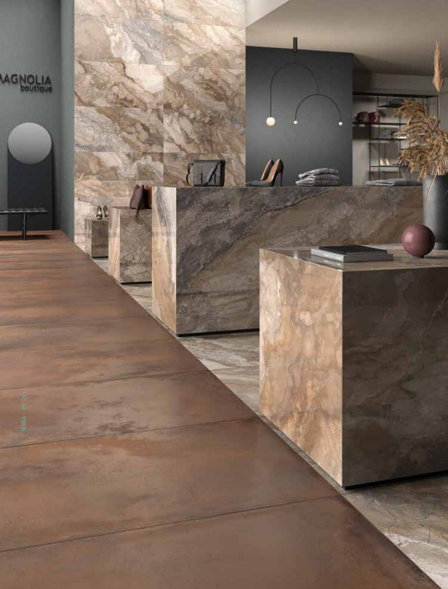
TERRA 120C RM - OR ILL 9018LP - OR ILL 12 RM