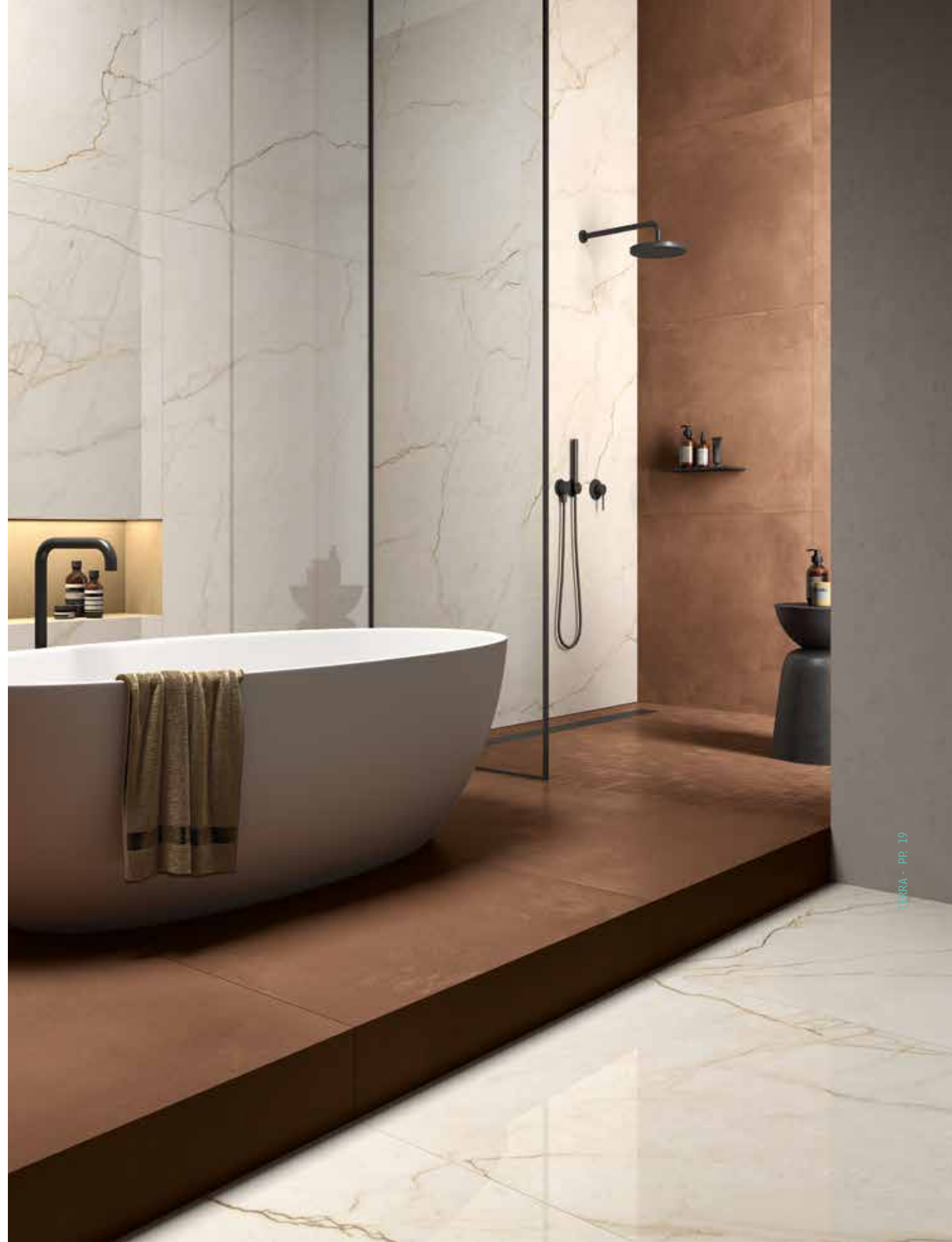
TERRA 90R RM - MK.TERRA 30R - OR CRE 9018 LP