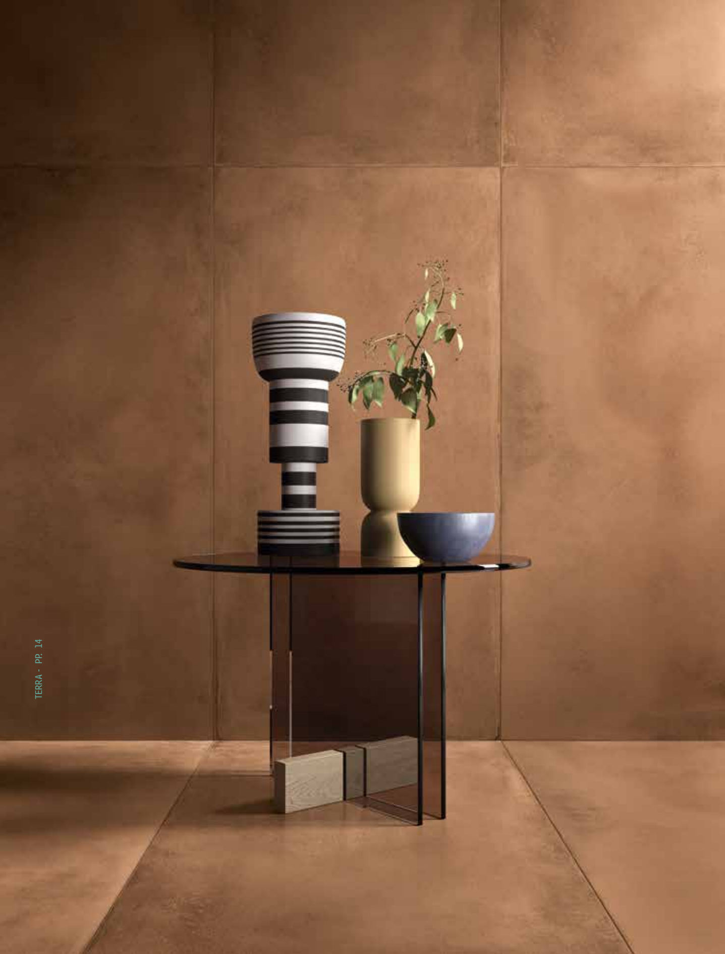
TERRA 12R RM