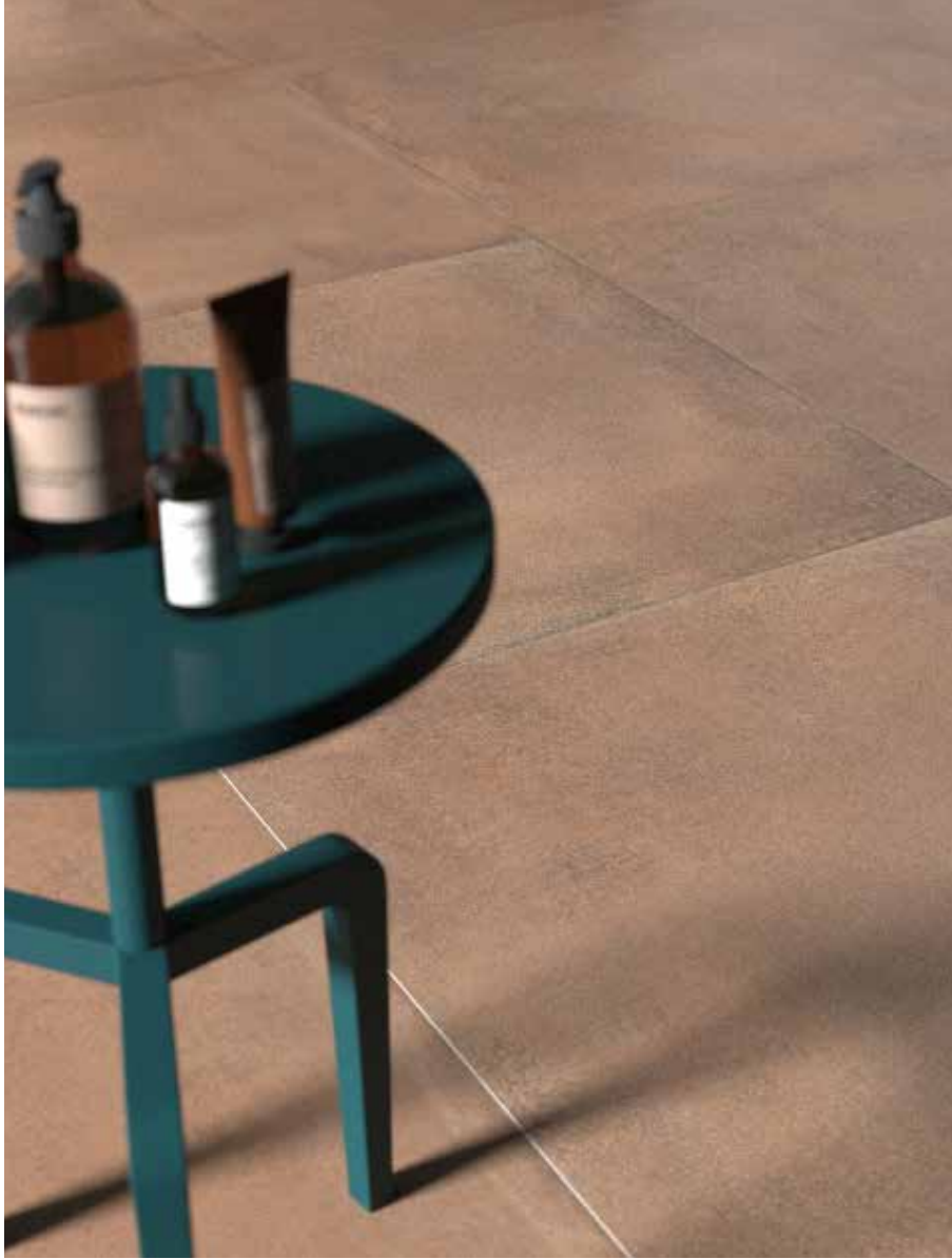
TERRA 900C RM