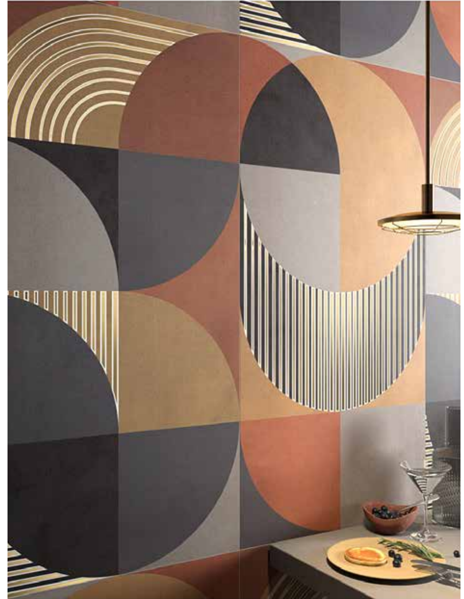
TERRA DK 12