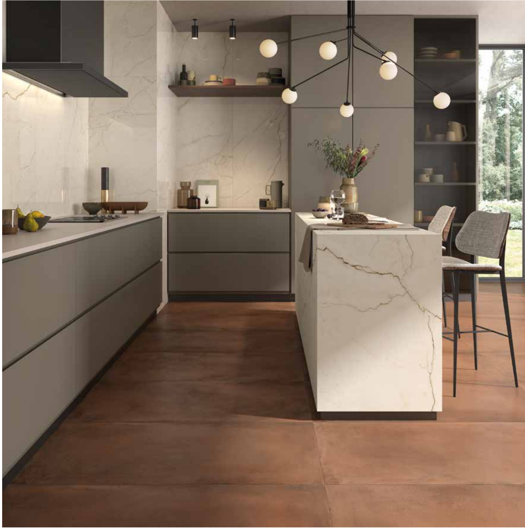
TERRA 12R RM - OR CRE 12 RM - OR CRE 12 LP