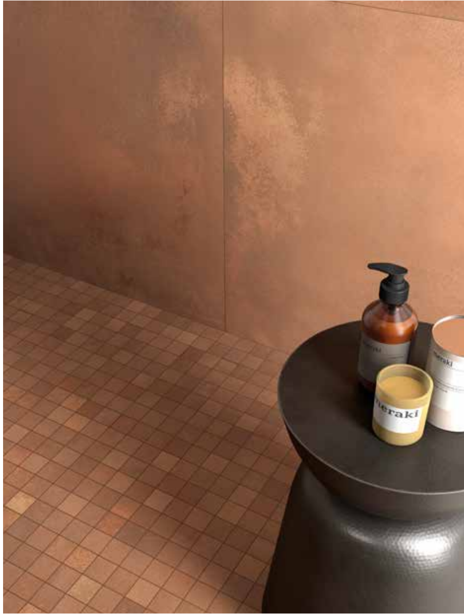
TERRA 90R RM - MK.TERRA 30R