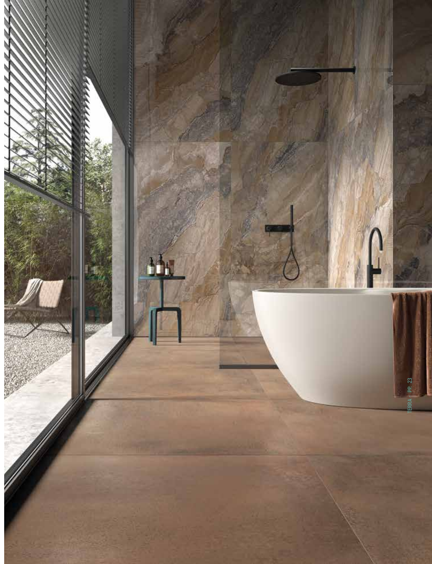
TERRA 900C RM - OR ILL 9018 LP