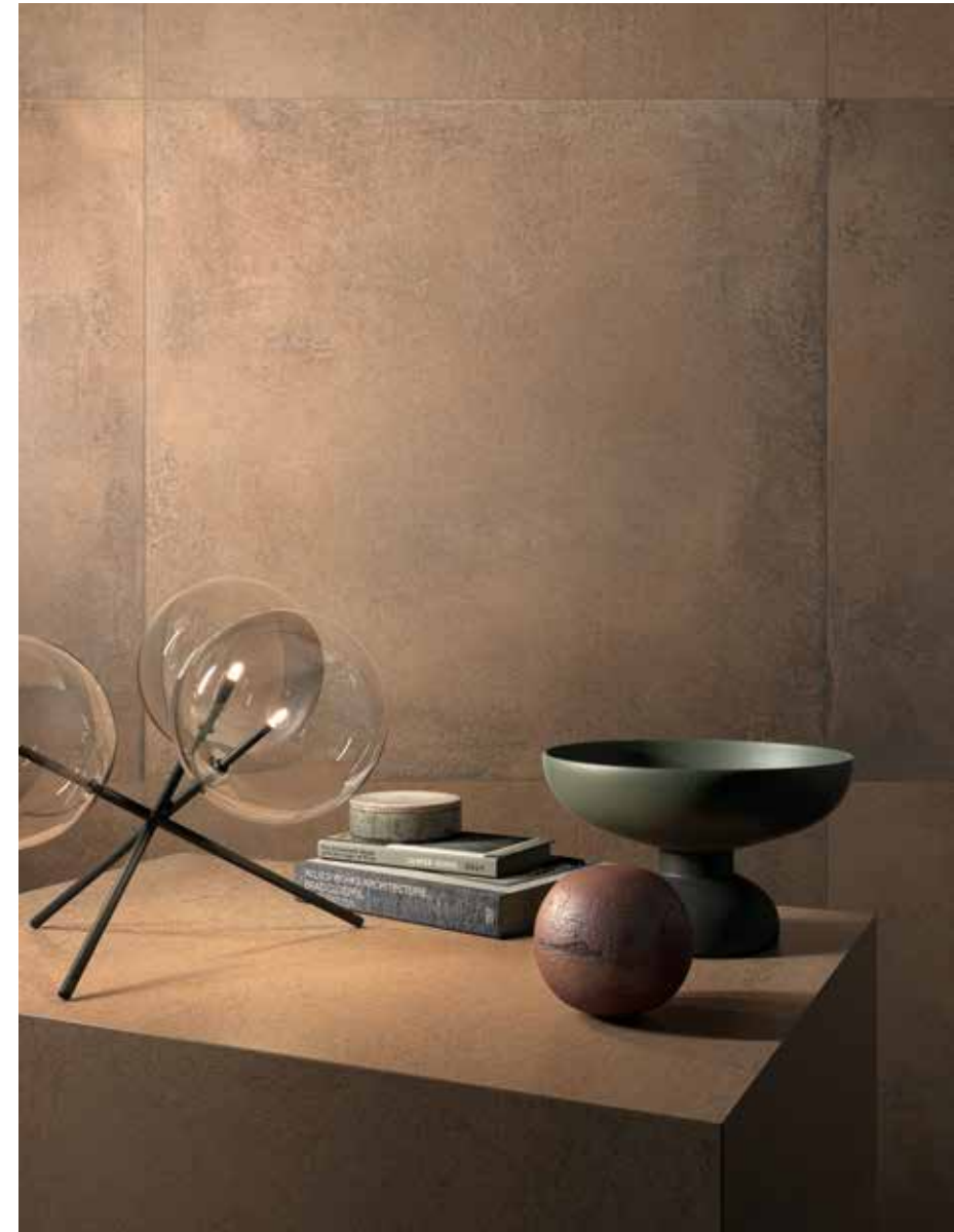
TERRA 900C RM