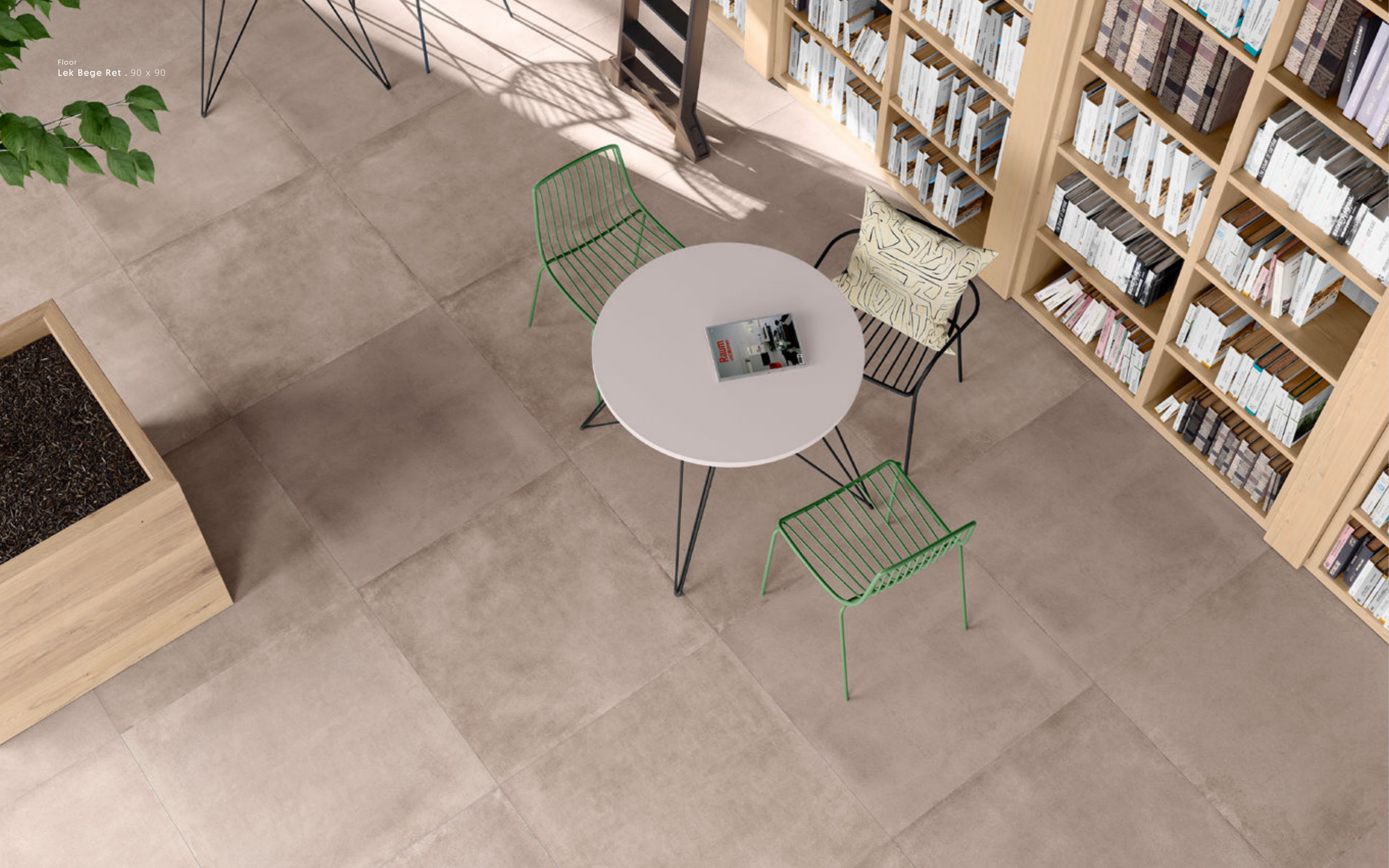
Floor Lek Bege Ret . 90 x 90