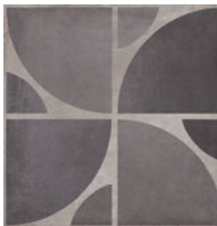
Lek Decor 1 Antracite