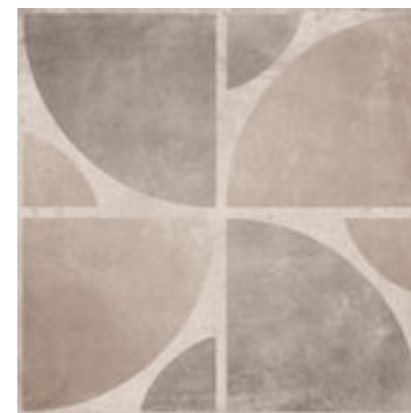
Lek Decor 1 Bege

Excepto produtos complementares. Except complementary products. A l'exception des produits complémentaires.